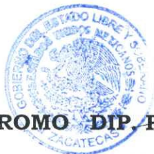
DIP. PABLO RODRÍGUEZ RODARTE